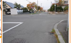
もみじ台東4丁目交差点

通学路となっている横断歩道 の無い交差点。見通しが悪く、 スピードを出した車の通行が 多い。