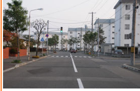
もみじ台東1丁目交差点

テクノパークやもみじ台通り に出る車が高速で通り抜ける。 冬期間は雪山で見通しが悪い。